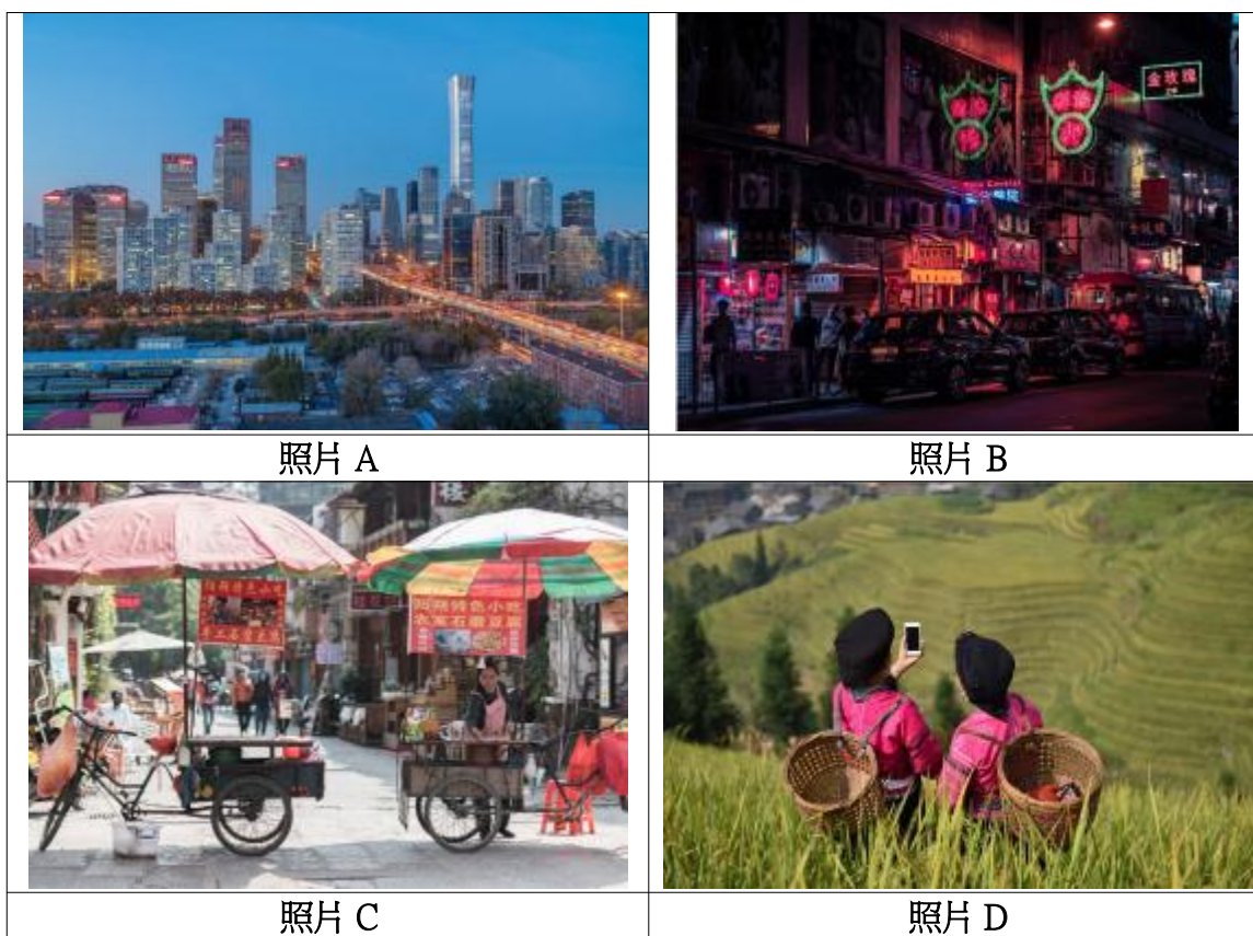
图 8.1 城市生活与农村生活的例子